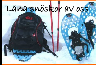
Låna snöskor av oss

Fjällskidåkning i en fantastisk fjällvärld med höga fjälltoppar runt omkring, eller pröva längdskidåkning i ett av världens största preparerade skidsystem, Nordic Ski.